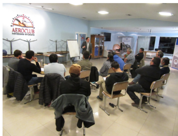
Materia Legales VANT, 1ra promoción, junio y julio 2018.

HORUS DRON ES LA PRIMERA ESCUELA DE PILOTOS DE DRON DE LA PATAGONIA ARGENTINA. TE PREPARA Y BRINDA TODOS LOS CONOCIMIENTOS TEÓRICOS Y PRÁCTICOS PARA QUE RINDAS EL EXAMEN ANTE ANAC Y PUEDAS CERTIFICARTE COMO PILOTO DE DRON Y/O VANT.